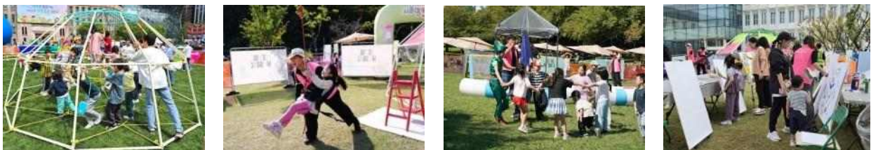
< ‘여기저기 서울형 키즈카페’ 사진 >