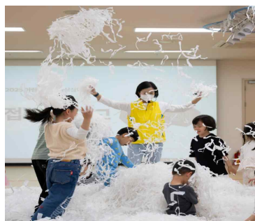
< 2025년 어린이날 행사 프로그램 : 바스락 종이 액션, 동물을 위한 종이숲 >