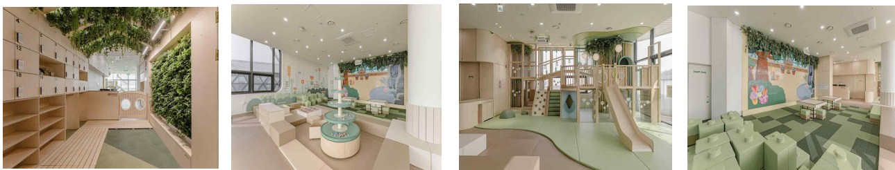
< 서울형 키즈카페 서울식물원점 사진 >

○ 서울시는 이번 신규 개관 시설 외에도 향후에도 실내·야외를 아우르는 다양한 유형의 놀이공간을 확충하고, 시민이 일상 가까이에서 이용할 수 있는 생활밀착형 놀이 인프라를 지속 확대해 나갈 계획이다.