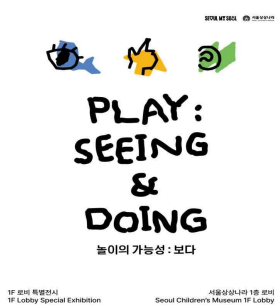
< 전시홍보포스터 >

□ 한편, 서울시 대표 어린이 전시체험·교육 시설인 ‘서울상상나라’(어린이대공원 내)는 ‘서울 키즈워크’를 맞아 로비를 체험형 놀이공간으로 재탄생시킨 특별전시 <놀이의 가능성: 보다>를 개최하고, 어린이날 특별 프로그램도 함께 운영한다.